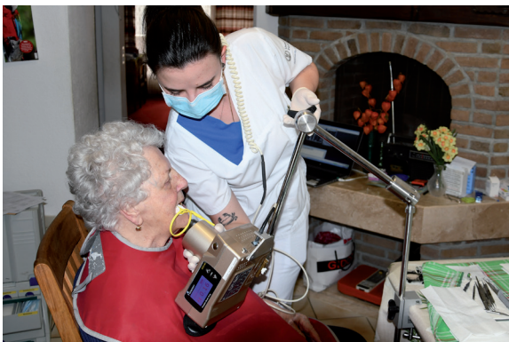
Behandlung zu Hause durch unsere mobile Zahnklinik

handlungen (Parodontitis) bis hin zu chirurgischen Eingriffen, Implantaten und abnehmbaren sowie festsitzenden Zahnersatz zum Einsatz. Ein umfassendes Hygieneangebot durch eine Dentalhygienikerin rundet das Angebot ab.